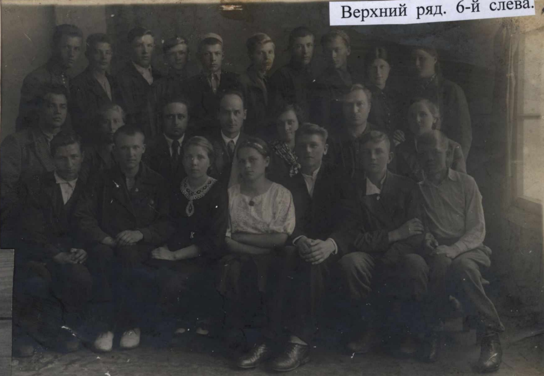
Группа II курса Строит.техн

1938-1939 год. Группа II-го курса стройтехникума.