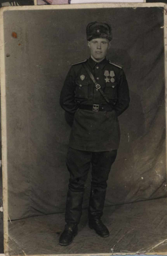
1945 год. учеба в военно-политическом училище имени Энгельса, город Ленинград