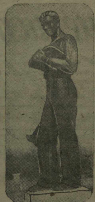
Наш город. Скульптура студента, установленная в Салу металлургов.

Рабочие металлургического треста «Сталинский металлургический», где главным тов. Гордеев, в значительное время изготовили значительное количество инструментов для строителей подшефной Сталинской области. Сделано по несколько десятков молотков слесарных, зубила, кувады кузнечные, калмы для штукатуров, кувады и кирочки для камешников и т. д.