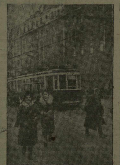
В ОСВОБОЖДЕННЫХ ГОРОДАХ НАШЕЙ РОДИНЫ. В Харькове восстановлено трамвайное движение по улицам города. На снимке: на площади Телелева.

Народный Комиссариат связи СССР выпустил серию почтовых марок, посвященных столетию со дня рождения великого русского композитора Н. А. Римского-Корсакова. Серия состоит из четырех марок достоинством в 30 и 60 копеек, 1 и 3 рубля.