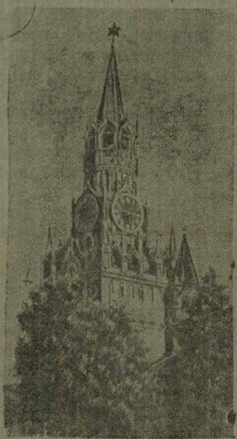
МОСКВА. Старинные Кремлевские куранты слушают весь мир. Их мелодичный звон розвещает очередной салют столицы нашей Родины доблестным войскам Красной Армии. На снимке: Кремлевская башня с курантами.