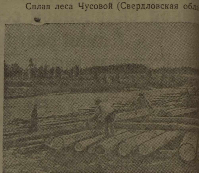
Отгрузка древесины на Билимбаевском сплавном участке.