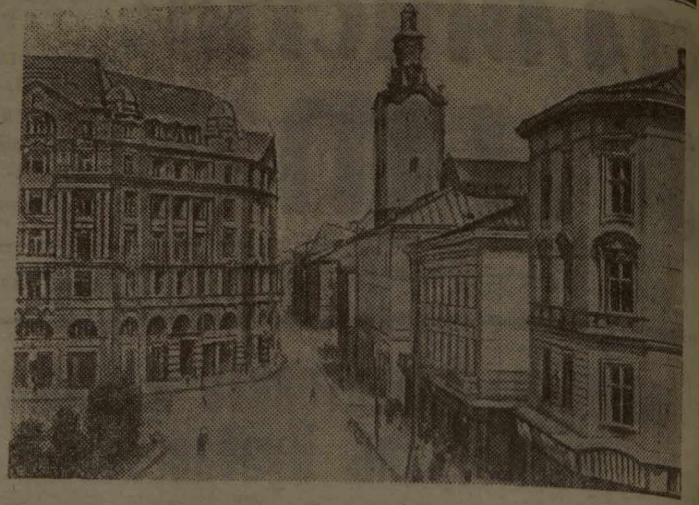
Город Львов, освобожденный войсками Красной Армии от немецко-фашистских захватчиков.