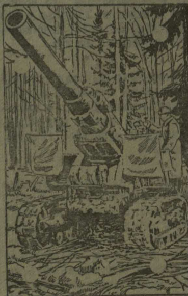
Действующая армия (Западный фронт)