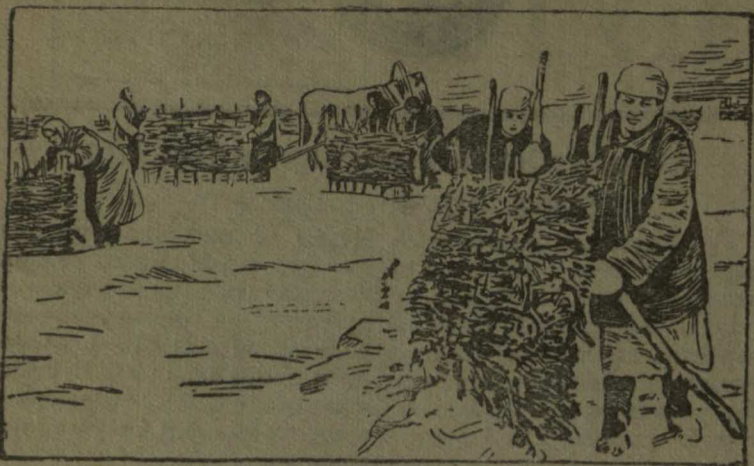
Колхозники сельхозартеля „14 годовщина Октября“, Гурьевского района, с первых дней зимы задерживают снег на полях. На снимке: расстановка щитов на участке второй бригады.