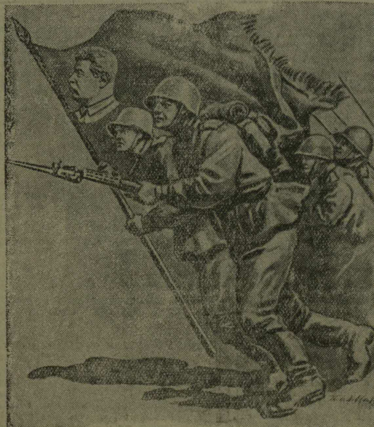
Вперед, за разгром немецких оккупантов!

Рисунок лауреата Сталинской премии художника П. Соколов-Скаля.